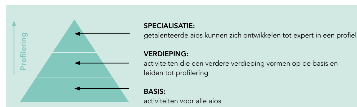
Figuur 1: Ontwikkelniveaus in actuele thema's

In CanBetter is de profilering van aios op thema's weergegeven in een piramidestructuur met drie niveaus.